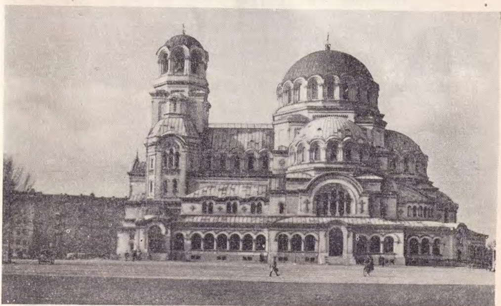
СОФИЙСКИЙ ПАТРИАРШИЙ КАФЕДРАЛЬНЫЙ СОБОР ВО ИМЯ СВ. БЛГВ. КНЯЗЯ АЛЕКСАНДРА НЕВСКОГО

Вся история болгарского народа — история многовековой борьбы против внешнего и внутреннего угнетения. Самый тяжкий период в истории этого многострадального славянского народа — турецкое иго, длившееся пять веков. Турки пытались принудить болгар отречься от своей национальной культуры и языка. В них всеми средствами старались задуть национальное самосознание и вытравить самую мысль о свободе.