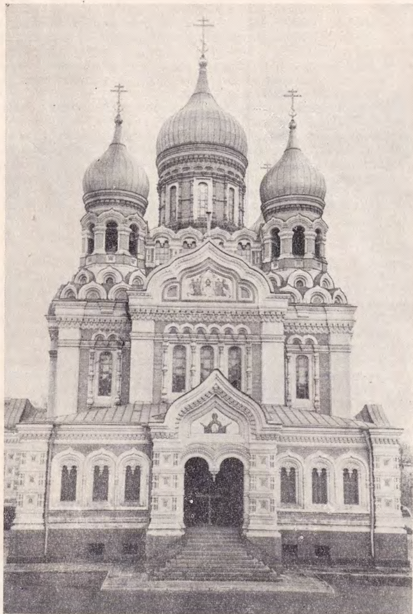
КАФЕДРАЛЬНЫЙ СОБОР ВО ИМЯ СВ. БЛГВ. КНЯЗЯ АЛЕКСАНДРА НЕВСКОГО в г. ТАЛЛИНЕ