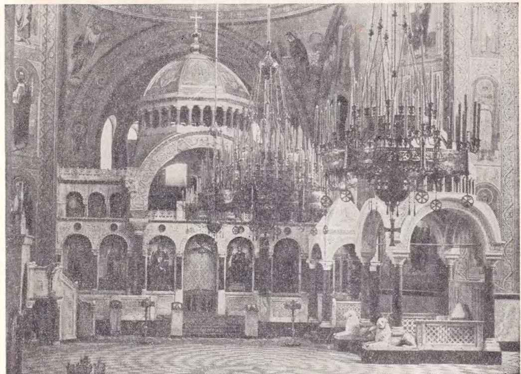
ГЛАВНЫЙ АЛТАРЬ СОФИЙСКОГО КАФЕДРАЛЬНОГО СОБОРА ВО ИМЯ СВ. БЛГВ. КНЯЗЯ АЛЕКСАНДРА НЕВСКОГО