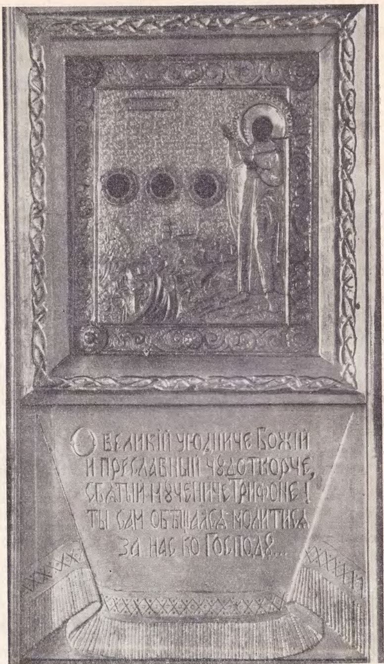
ОБРАЗ МУЧЕНИКА ТРИФОНА В ХРАМЕ В ЧЕСТЬ ИКОНЫ БОЖИЕЙ МАТЕРИ «ЗНАМЕНИЕ».