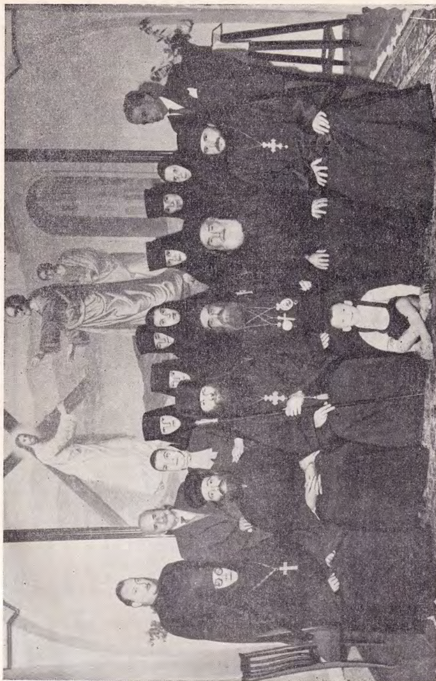
БЛАЖЕННЕЙШИЙ ПАТРИАРХ ИЕРУСАЛИМСКИЙ ВЕНЕДИКТ СРЕДИ ЛИЦ, ВСТРЕЧАВШИХ ЕГО В РУССКОЙ ДУХОВНОЙ МИССИИ В ИЕРУСАЛИМЕ 10 ноября 1959 года