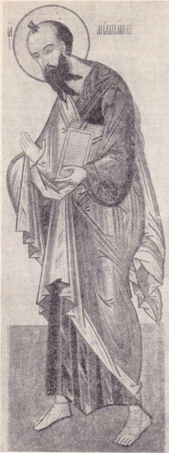
АПОСТОЛ ПАВЕЛ (ИКОНА XVI ВЕКА)