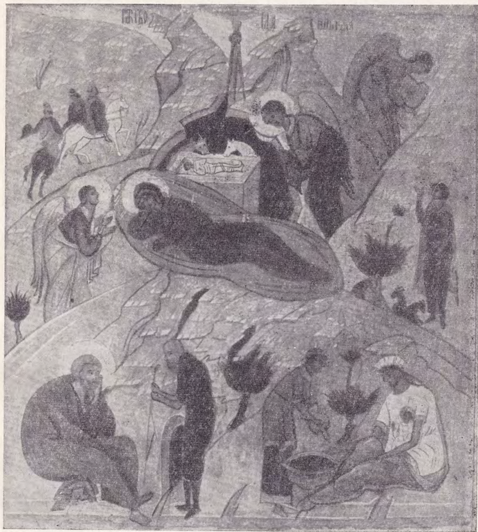
РОЖДЕСТВО ХРИСТОВО (ИКОНА XV ВЕКА)