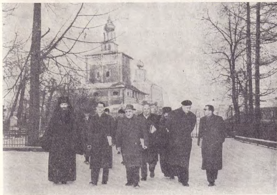
ДЕЛЕГАЦИЯ ЕВАНГ.-ЛЮТЕР. ЦЕРКВИ ИЗ ГДР ОСМАТРИВАЕТ ТРОИЦЕ-СЕРГИЕВУ ЛАВРУ