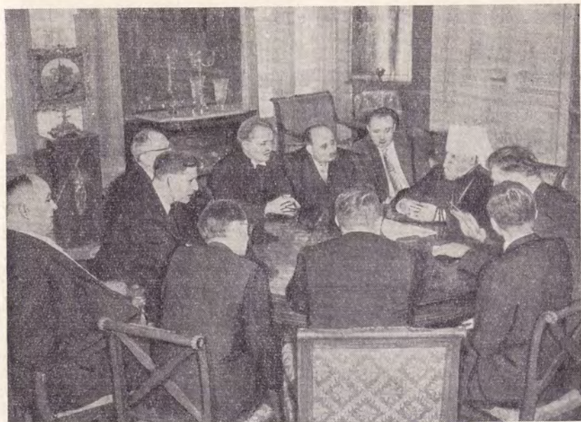
ДЕЯТЕЛИ ЕВАНГ.-ЛЮТЕР. ЦЕРКВИ ИЗ ГДР НА ПРИЕМЕ У МИТРОПОЛИТА НИКОЛАЯ