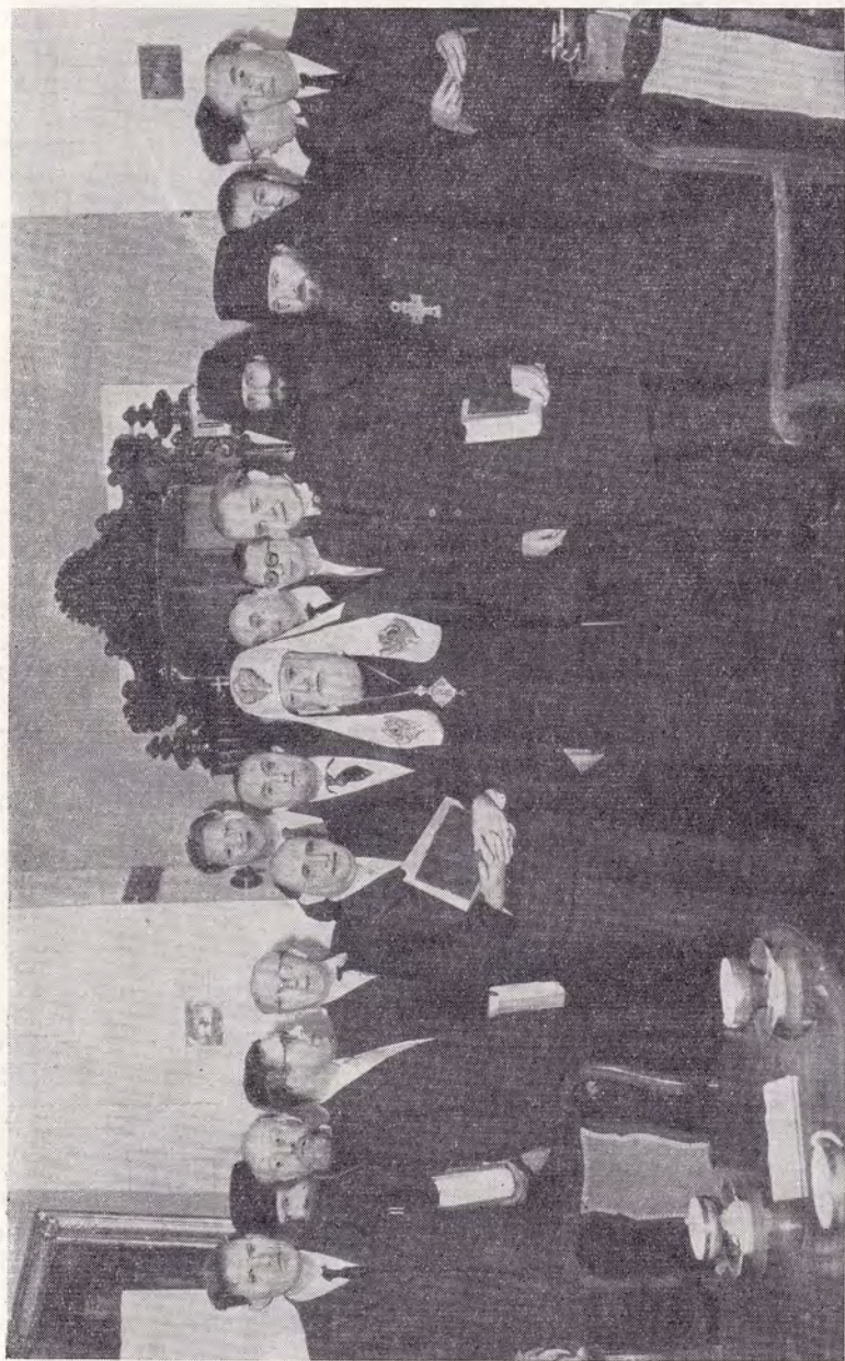
СВЯТЕЙШИЙ ПАТРИАРХ АЛЕКСИЙ ПРИНЯЛ ДЕЯТЕЛЕЙ ЕВАНГ.-ЛЮТЕР. ЦЕРКВИ ИЗ ГДР В СВОИХ ПОКОЯХ В ТРОИЦЕ-СЕРГИЕВОЙ ЛАВРЕ