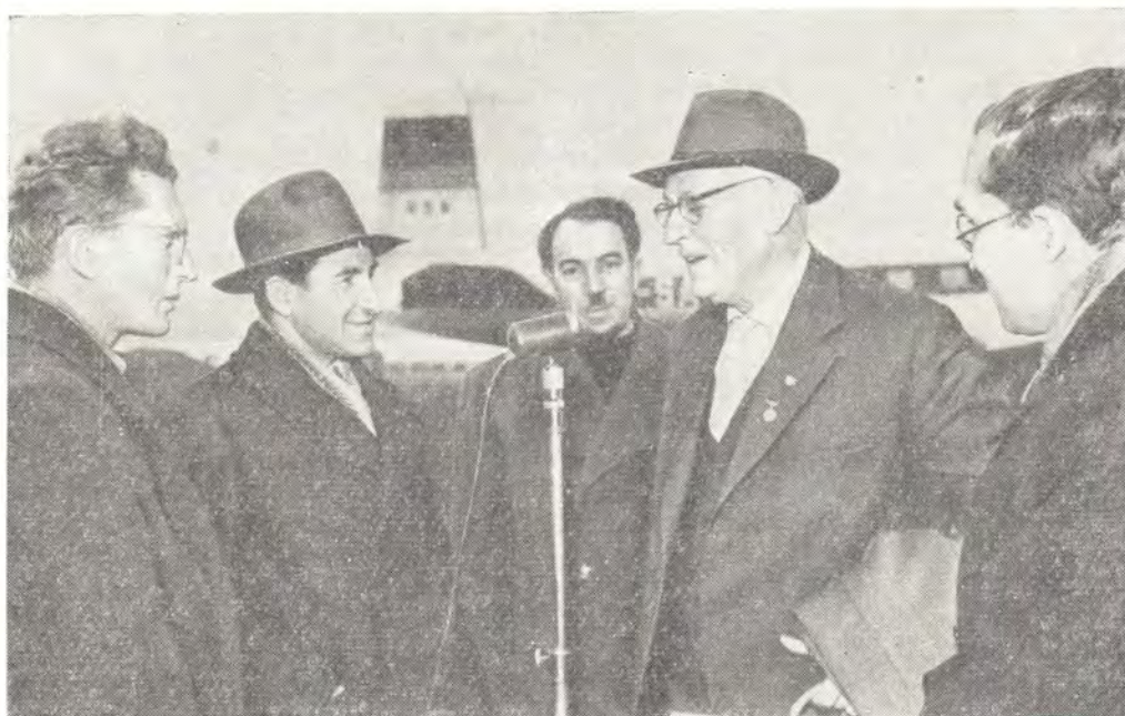
ВСТРЕЧА ПАСТОРА ЦЕРКВИ ДАНИИ, ЧЛЕНА БЮРО ВСЕМИРНОГО СОВЕТА МИРА УФФЕ ХАНСЕНА НА ВНУКОВСКОМ АЭРОДРОМЕ