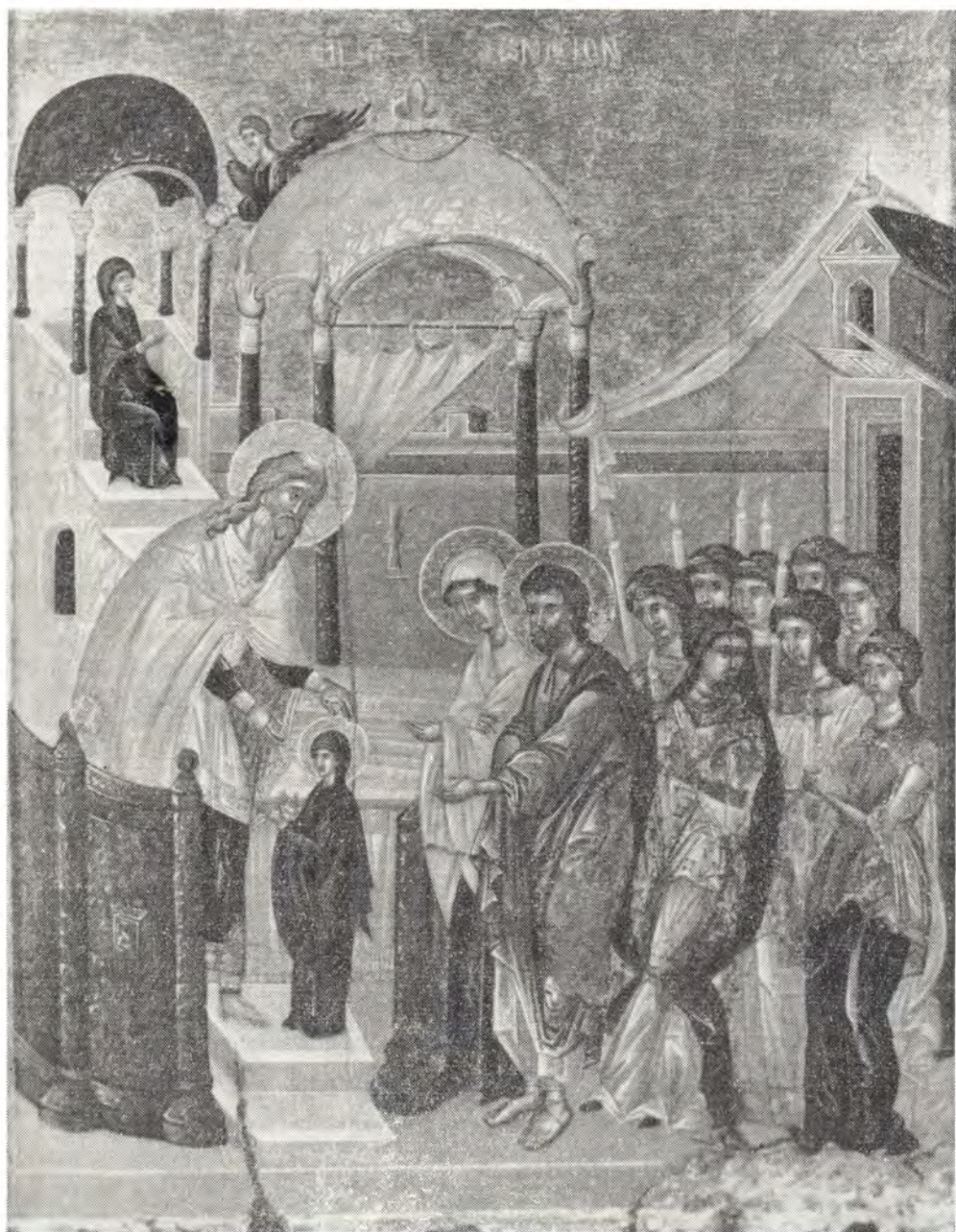
ВВЕДЕНИЕ ВО ХРАМ ПРЕСВЯТОЙ БОГОРОДИЦЫ