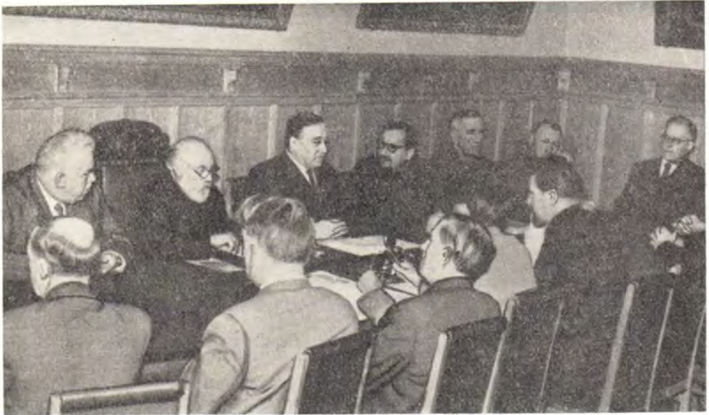
ПРОФЕССОРА И ПРЕПОДАВАТЕЛИ ЛЕНИНГРАДСКОЙ ДУХОВНОЙ АКАДЕМИИ ВО ВРЕМЯ ТОРЖЕСТВЕННОГО АКТА

Во время той части доклада, где говорилось об успеваемости учащихся, Митрополит Питирим вручил отличникам-студентам академии и воспитанникам семинарии книги «Новый Завет» на русском языке с соответствующими надписями.