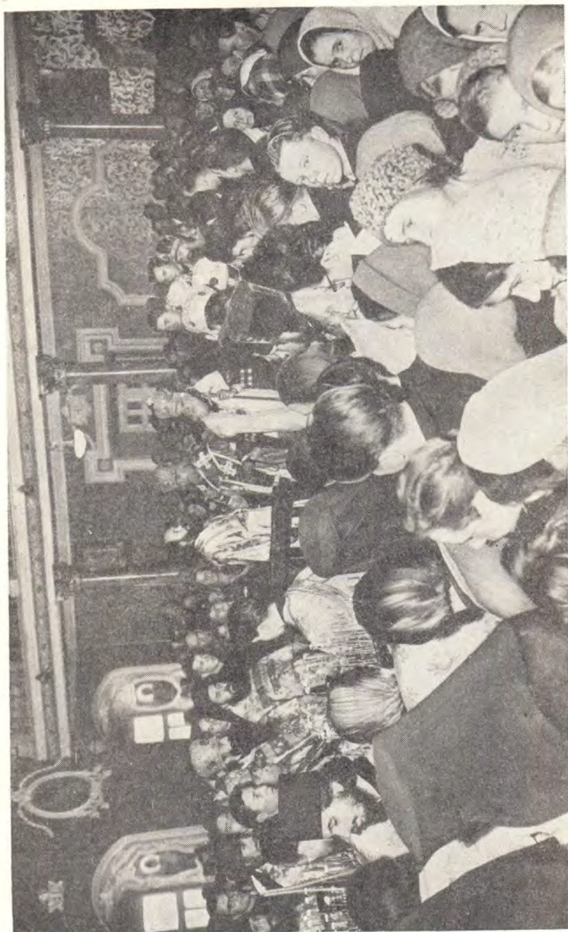
СВЯТЕЙШИЙ ПАТРИАРХ АЛЕКСИЙ СОВЕРШАЕТ МОЛБЕН ПОСЛЕ БОЖЕСТВЕННОЙ ЛИТУРГИИ В ХРАМЕ МОСКОВСКОЙ ДУХОВНОЙ АКАДЕМИИ В ДЕНЬ ПОКРОВА БОЖИЕЙ МАТЕРИ