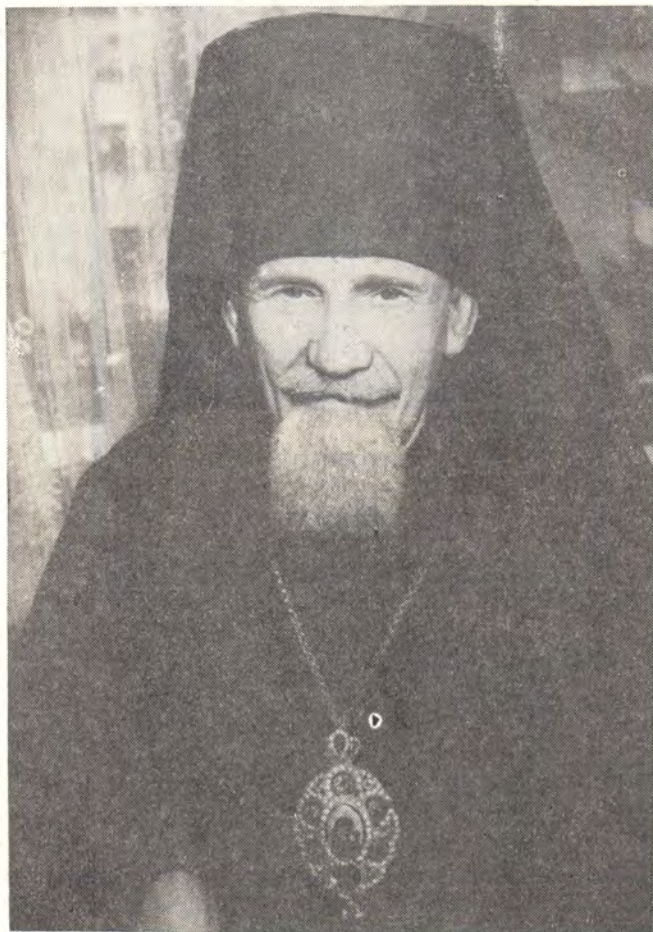
ДОСИФЕЙ, ЕПИСКОП НЬЮ-ЙОРКСКИЙ