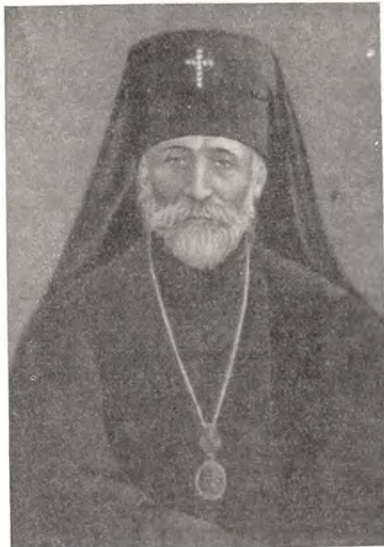
АЛЕКСАНДР, АРХИЕПИСКОП БРЮССЕЛЬСКИЙ И БЕЛЬГИЙСКИЙ

архиепископа Евдокима, после чего вступил в управление Русской Церковью в Америке. В конце 1917 года он был утвержден в этой должности Патриархом Тихоном. В 1921 году в США прибыл управлявший ранее Американской епархией митрополит Платон. Архиепископ Александр, уступая первенство старшему иерарху, отстранился от руководства епархией и покинул Америку. С конца 1921 года он в течение ряда лет пребывал в Константинополе, сотрудничая со Вселенским патриаршим престолом. Когда в конце 20-х годов турецкие власти стали вводить всевозможные административные ограничения для проживавших в Турции русских, архиепископ Александр был ввергнут в тюрьму. После того, как турецкое правительство приняло решение о высылке его из Турции, Преосвященный Александр при содействии Константинопольского Патриархата выехал на Афон, где жил в Андреевском русском скиту. Вселенский Патриарх удостоил его права ношения креста на клобуке и на митре.