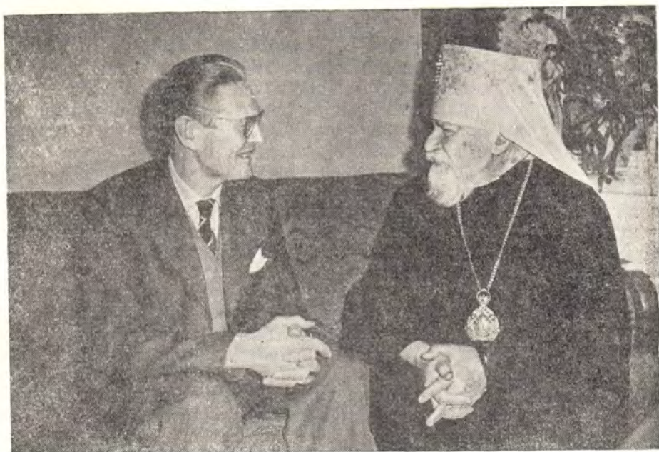
МИТРОПОЛИТ НИКОЛАЙ БЕСЕДУЕТ С ПАСТОРОМ ОСКАРОМ РУНДБЛОМОМ В МОСКОВСКОЙ ПАТРИАРХИИ

Совсем недавно Москву посетила делегация Шведской Церкви; ее члены были приняты иерархами Русской Православной Церкви; делегация присутствовала за богослужениями в московских храмах.