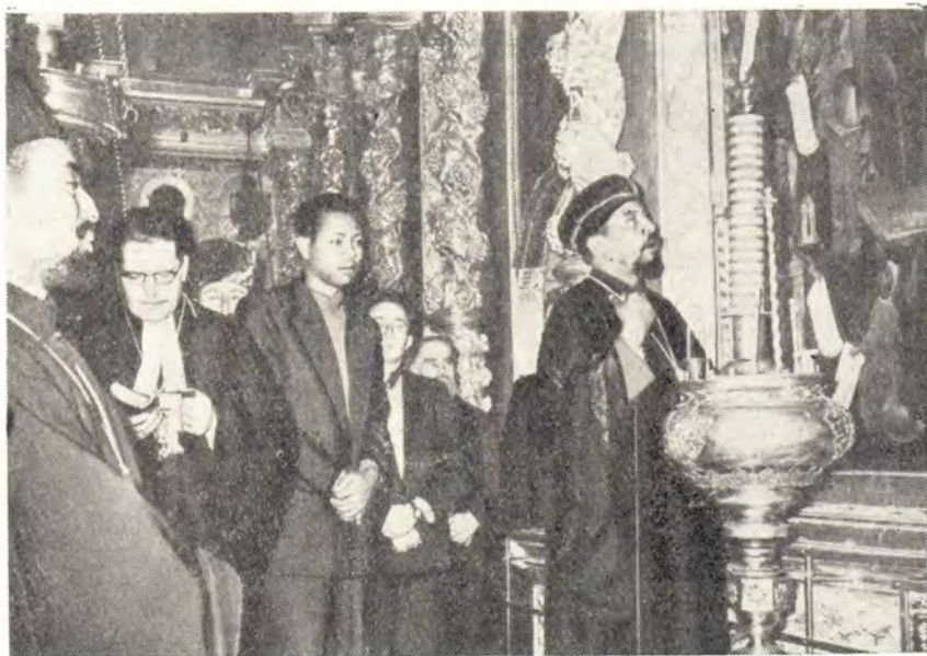
ДЕЛЕГАЦИЯ ЭФИОПСКОЙ ЦЕРКВИ В УСПЕНСКОМ СОБОРЕ ТРОИЦЕ-СЕРГИЕВОЙ ЛАВРЫ ЗА ЛИТУРГИЕЙ В ДЕНЬ УСПЕНИЯ ПРЕСВЯТОЙ БОГОРОДИЦЫ