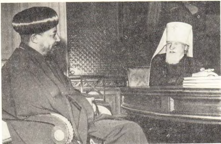
МИТРОПОЛИТ КРУТИЦКИЙ И КОЛОМЕНСКИЙ НИКОЛАЙ БЕСЕДУЕТ С ГЛAVОЙ ДЕЛЕГАЦИИ МИТРОПОЛИТОМ ХАРАРСКИМ АБУНОЙ ФЕОФИЛОМ