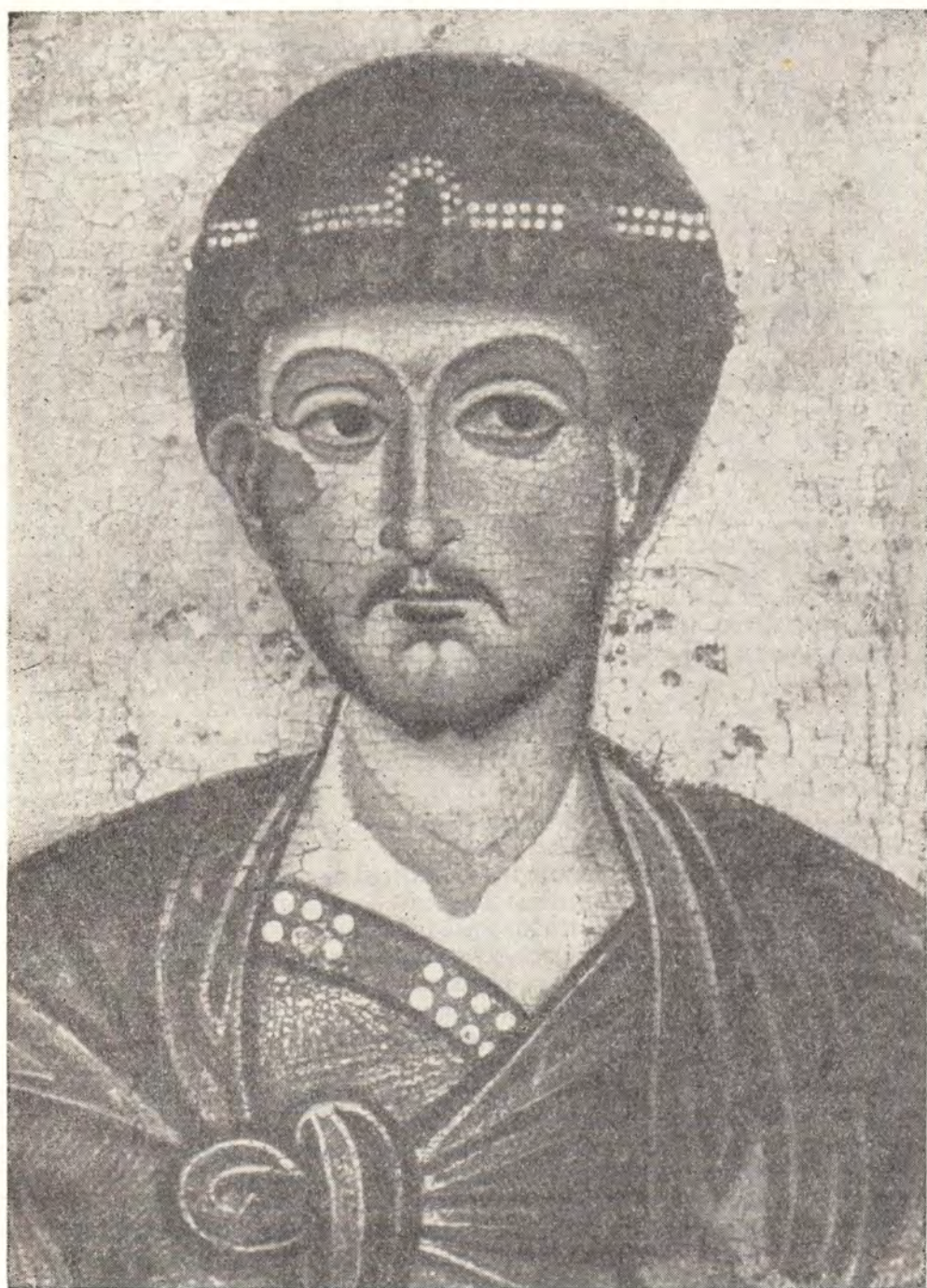
СВ. ВЛКМЧ. ДИМИТРИЈ СОЛУНСКИИ (ИКОНА XII—XIII ВЕКА)