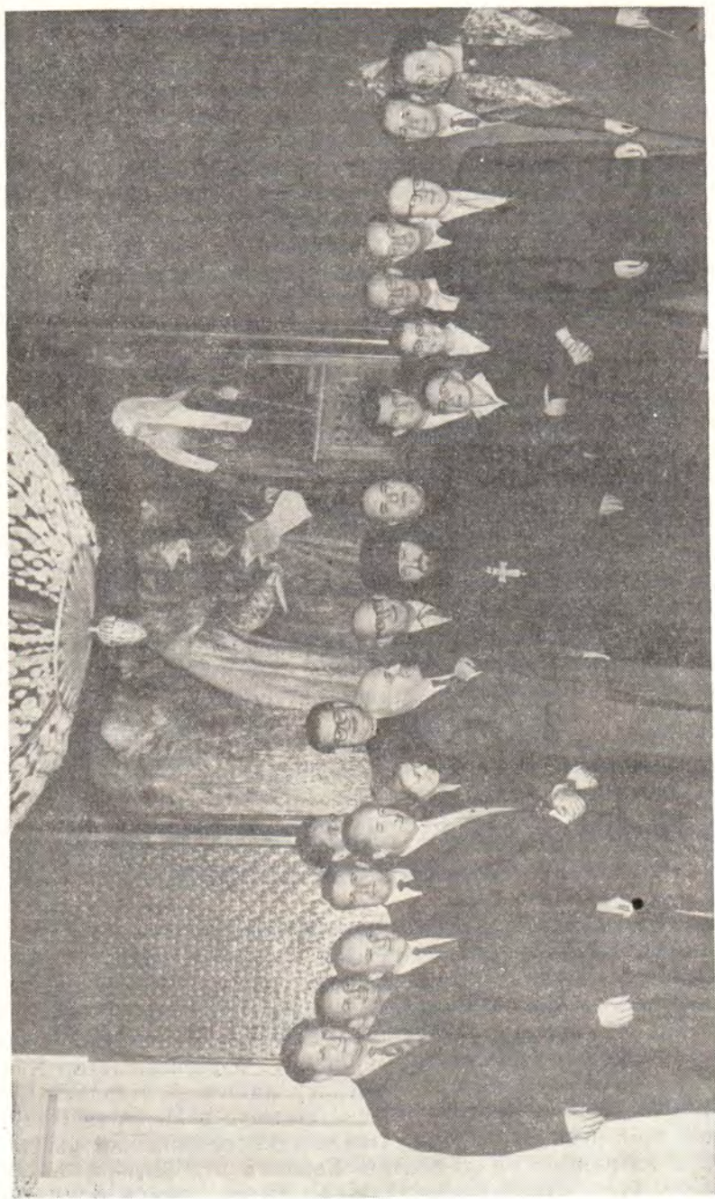
ГРУППА ДЕЯТЕЛЕЙ ЕВАНГЕЛИЧЕСКО-ЛЮТЕРАНСКОЙ ЦЕРКВИ ИЗ ЗАП. БЕРЛИНА НА ПРИЕМЕ В МОСКОВСКОЙ ПАТРИАРХИИ