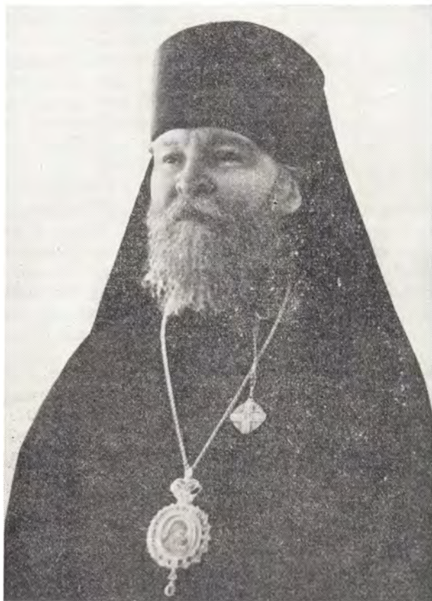
ИННОКЕНТИЙ, ЕПИСКОП СМОЛЕНСКИЙ И ДОРОГБУЖСКИЙ

Чин наречения совершали: Святейший Патриарх Московский и всея Руси Алексий, архиепископ Можайский Макарий и епископ Дмитровский Пимен.