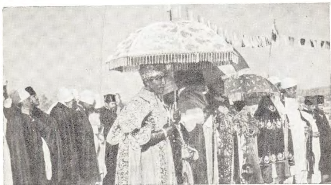
ГРУППА ЭФИОПСКОГО ДУХОВЕНСТВА НА ПРАЗДНИКЕ КРЕЩЕНИЯ ГОСПОДНЯ