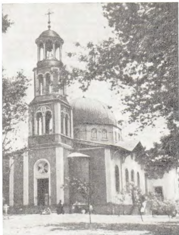
КАФЕДРАЛЬНЫЙ СОБОР СВ. МАРИИ В г. АДДИС-АБЕБЕ