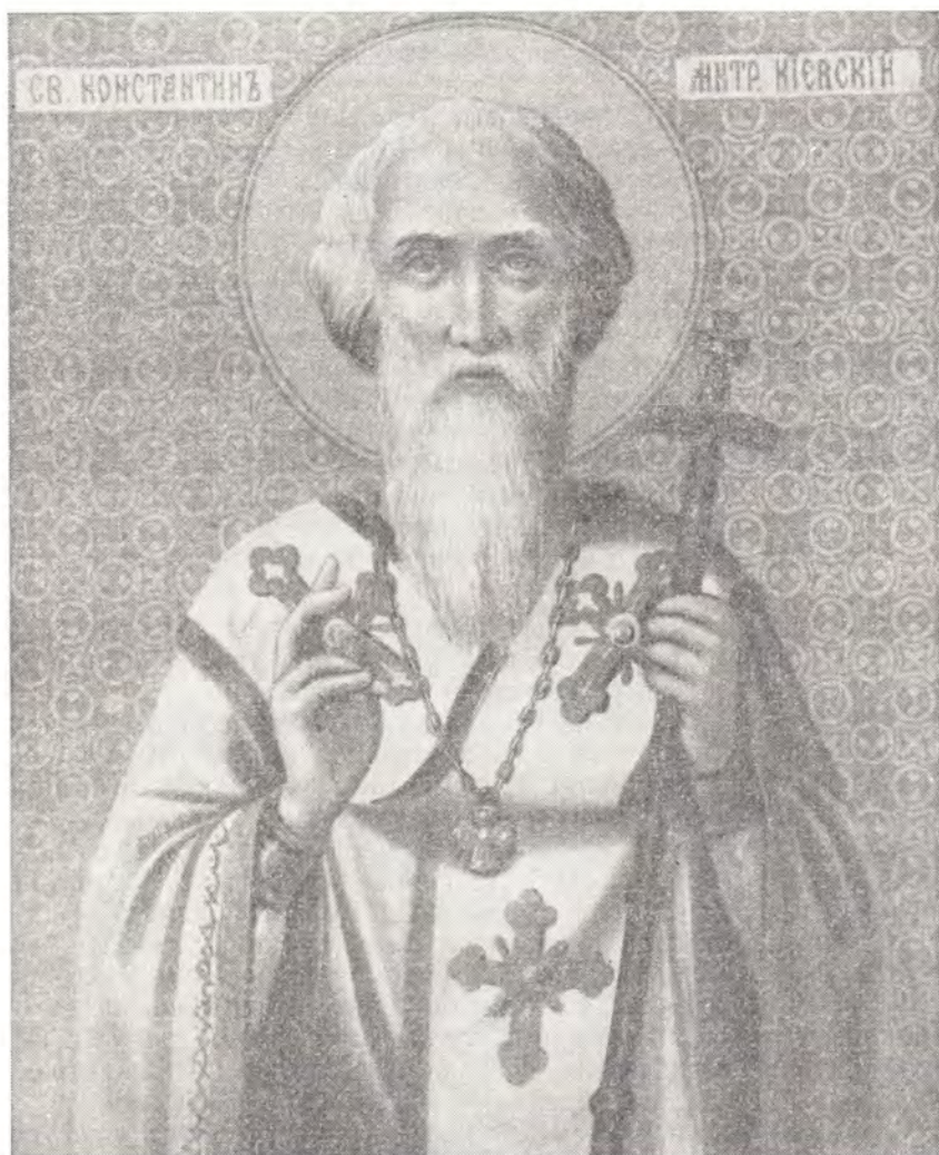
СВ. КОНСТАНТИН, МИТРОПОЛИТ КИЕВСКИЙ