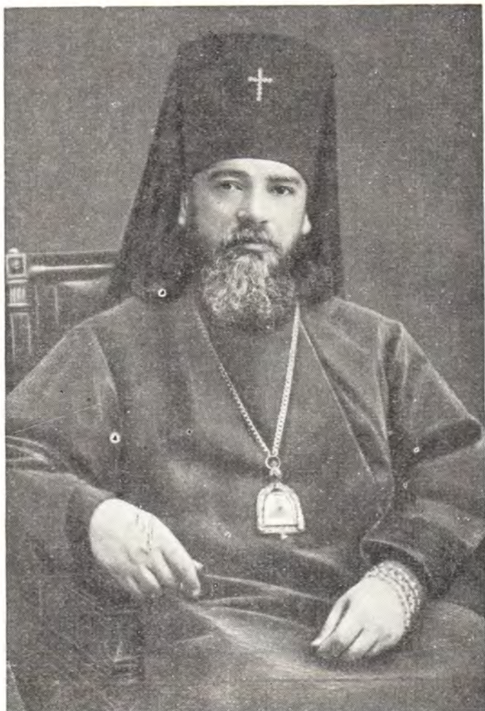
АРХИЕПИСКОП АЛЕКСИЙ 1931 г.

Особенно большое значение (в смысле приобретения административно-педагогического опыта) имели в жизни иеромонаха Алексея первые месяцы 1905 года, когда, в связи с уходом ректора о. Бориса, молодому