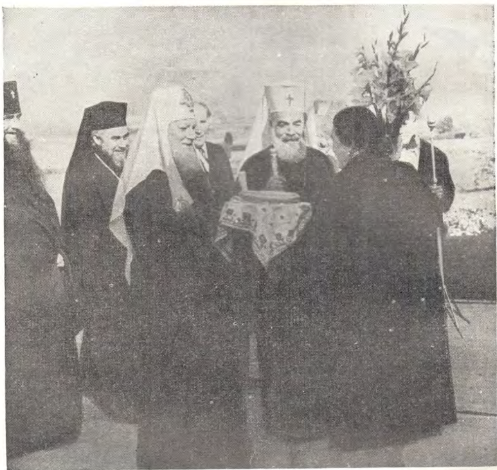
К ПОСЕЩЕНИЮ СВЯТЕЙШИМ ПАТРИАРХОМ АЛЕКСИЕМ БОЛГАРИИ (в 1957 г.) В СВЯЗИ С 80-ЛЕТИЕМ ЕЕ ОСВОБОЖДЕНИЯ ОТ ИНОЗЕМНОГО ИГА. ВСТРЕЧА С ХЛЕБОМ-СОЛЮ

и отец! — так начал Ленинградский Митрополит. — ...Скоро уже девять лет, как ты, Господу поспешествуя, бесменно и непрерывно несешь бремя кормчего этой Церкви, при помощи Божией, объединяя всех около себя и являя всем нам, по апостолу, «образ словом, житием, любовью, духом, верою, чистотою» (1 Тим. 4, 12). Благодарим с тобою Господа за пройденный путь и, благодаряще, молим Его благодать продолжить над