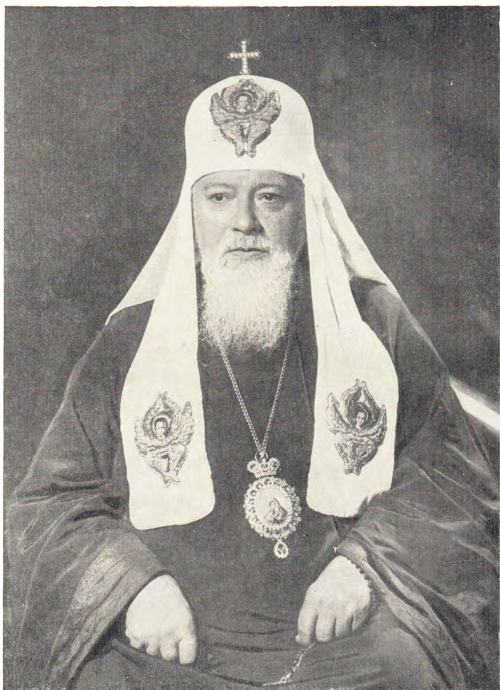
СВЯТЕЙШИЙ ПАТРИАРХ МОСКОВСКИЙ И ВСЕЯ РУСИ АЛЕКСИЙ