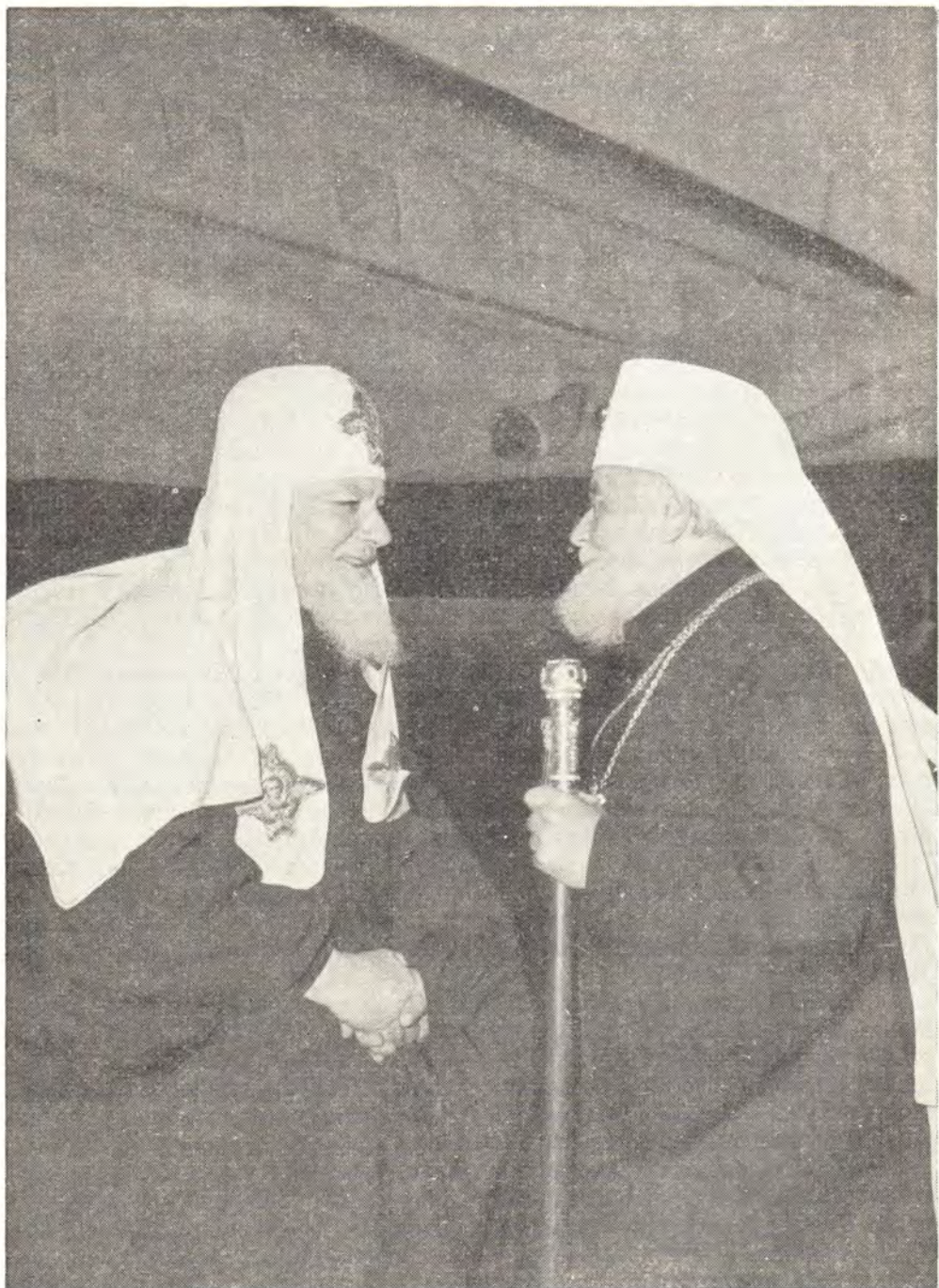
СВЯТЕЙШИЙ ПАТРИАРХ СЕРБСКИЙ ВИКЕНТИЙ ПРИВЕТСТВУЕТ ПРИБЫВШЕГО С ОТВЕТНЫМ ВИЗИТОМ ВО ГЛАВЕ ДЕЛЕГАЦИИ РУССКОЙ ПРАВОСЛАВНОЙ ЦЕРКВИ СВЯТЕЙШЕГО ПАТРИАРХА АЛЕКСИЯ