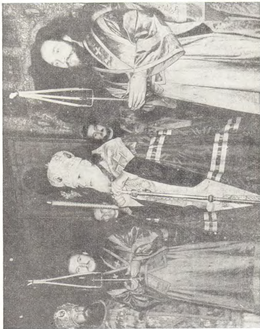
СВЯТЕЙШИЙ ПАТРИАРХ АЛЕКСИЙ ПРОИЗНОСИТ СЛОВО ЗА БОЖЕСТВЕННОЙ ЛИТУРГИЕЙ В ТРОИЦКОМ СОБОРЕ ТРОИЦЕ-СЕРГИЕВОЙ ЛАВРЫ В ДЕНЬ ПАМЯТИ ПРЕСТАВЛЕНИЯ ПРЕПОДОБНОГО СЕРГИЯ 8 ОКТЯБРЯ 1957 Г.