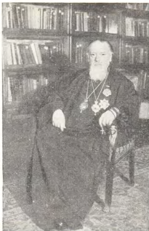
СВЯТЕЙШИЙ ПАТРИАРХ АЛЕКСИЙ В СВОЕМ КАБИНЕТЕ

«Мы — свидетели тому, что ваше отношение к нам было простым и добрым, — говорит другой ученик — Вениамин Глаголев; — за это человеческое отношение к нам мы и благодарим вас здесь теперь, в прощальный час... Кланяемся уму, кланяемся сердцу, кланяемся человеку, прежде всего и более всего человеку...» 15