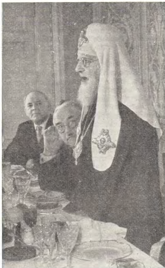
СВЯТЕЙШИЙ ПАТРИАРХ АЛЕКСИЙ ОТВЕЧАЕТ НА ПОЗДРАВЛЕНИЯ НА ОФИЦИАЛЬНОМ ПРИЕМЕ, УСТРОЕННОМ В ЕГО ЧЕСТЬ ПРЕДСЕДАТЕЛЕМ СОВЕТА ПО ДЕЛАМ РУССКОЙ ПРАВОСЛАВНОЙ ЦЕРКВИ ПРИ СОВЕТЕ МИНИСТРОВ СССР Г. Г. КАРПОВЫМ

40-летия со дня Великого Октября Советскую страну горячо приветствуют и поздравляют не только сторонники социализма, но и все миролюбивые честные люди на земле независимо от их политических и религиозных убеждений.