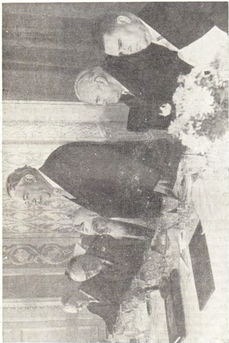
Г. Г. КАРПОВ, ПРЕДСЕДАТЕЛЬ СОВЕТА ПО ДЕЛАМ РУССКОЙ ПРАВОСЛАВНОЙ ЦЕРКВИ ПРИ СОВЕТЕ МИНИСТРОВ СССР, ПРОИЗНОСИТ ПОЗДРАВИТЕЛЬНУЮ РЕЧЬ НА ОФИЦИАЛЬНОМ ПРИЕМЕ, ДАННОМ ИМ ПО СЛУЧАЮ 80-ЛЕТИЯ ПАТРИАРХА АЛЕКСИЯ