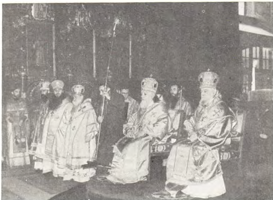
СВЯТЕЙШИЙ ПАТРИАРХ АЛЕКСИЙ И СВЯТЕЙШИЙ ПАТРИАРХ СЕРБСКИЙ ВИКЕНТИЙ ЗА БОЖЕСТВЕННОЙ ЛИТУРГИЕЙ В ПАТРИАРШЕМ БЕЛГРАДСКОМ СОБОРЕ 13 октября 1957 г.

В субботу, 12 октября, делегация Русской Православной Церкви во главе с Патриархом Алексием нанесла визиты Союзному Исполнительному Вечу Югославии, где была принята Заместителем Председателя