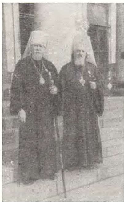
МЕСТОБЛЮСТИТЕЛЬ МИТРОПОЛИТ АЛЕКСИЙ И МИТРОПОЛИТ НИКОЛАЙ. 1944 г.

вовать, — говорил архипастырь, — не значит господствовать, а значит быть первым, управлять, направлять на прямую дорогу... И ты, возлюбленный брат, помни, что не избежишь неправды и клеветы человеческой. Будешь исполнять свой долг и поступать по закону, — заслужишь нареkania в формализме, придирчивости. Будешь относиться к людям только с любовью, снисходительно, — не избежишь обвинения в том, что не держишь, как следует, бразды правления. Где же найти утешение? — спросишь ты, испытав на опыте тяготы начальствования. Оно только в молитве и в сознании исполненного долга...» 10 .