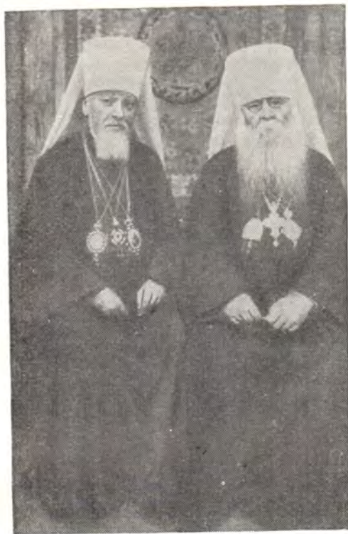
МИТРОПОЛИТ ЛЕНИНГРАДСКИЙ АЛЕКСИЙ ПРИ ВСТРЕЧЕ С МЕСТОБЛЮСТИТЕЛЕМ МИТРОПОЛИТОМ СЕРГИЕМ В 1943 г.

иерархов да восхвалим». Затем рисуются образы великих каппадокийцев в дни их юности. Любовь к учению и молитве была их главной чертой. Указывая на то, что, учась у языческих мудрецов, боговдохновенные юноши сохранили беспримерную веру в Христа, проповедник призывает к неуклонному им подражанию: «Читайте отцов дѣянием», — говорит один мудрый пустынножитель. И вам я должен сказать: читайте этих святых самую жизнью вашею, то есть не оставляйте втуне их заветов в