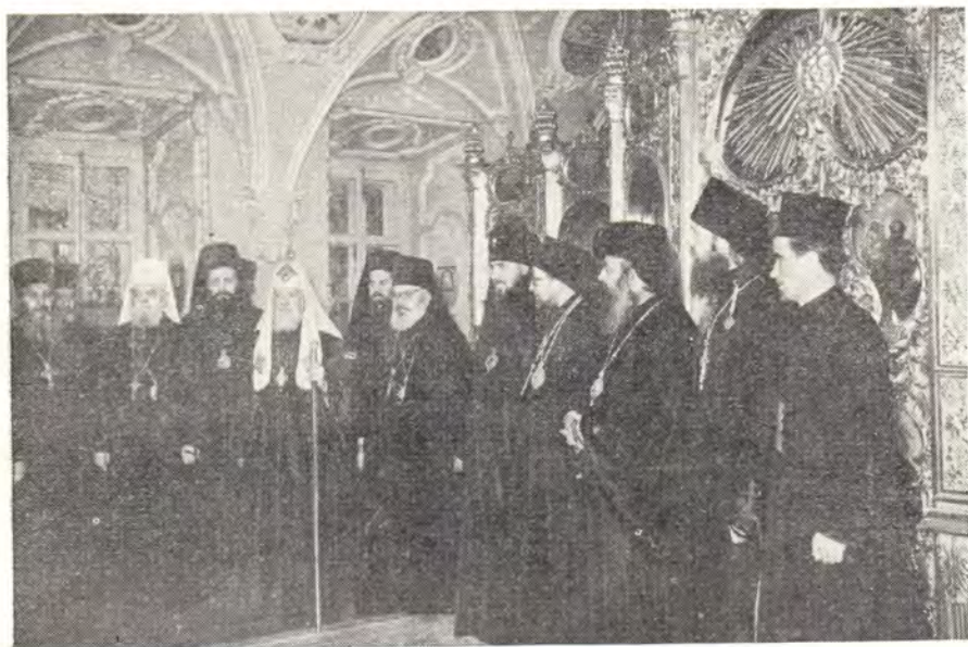
ПРИЕМ СЕРБСКОЙ ЦЕРКОВНОЙ ДЕЛЕГАЦИИ ВО ГЛАВЕ С ПАТРИАРХОМ ВИКЕНТИЕМ У ПАТРИАРХА АЛЕКСИЯ В ЕГО ПОКОЯХ В ТРОИЦЕ-СЕРГИЕВОЙ ЛАВРЕ (г. Загорск). 1956 г.

Гражданская добросовестность и строгая каноничность — такова линия, проводимая епископом с непоколебимой твердостью — линия, от которой он, как церковный деятель, не отступил ни разу, несмотря на жестокую бурю, сотрясавшую в те дни церковный корабль. Эта мудрая, дальновидная позиция создала ему большой авторитет среди верующих людей; она совпала с той позицией, которую занимал мудрейший из русских иерархов Митрополит Нижегородский Сергей (Страгородский).