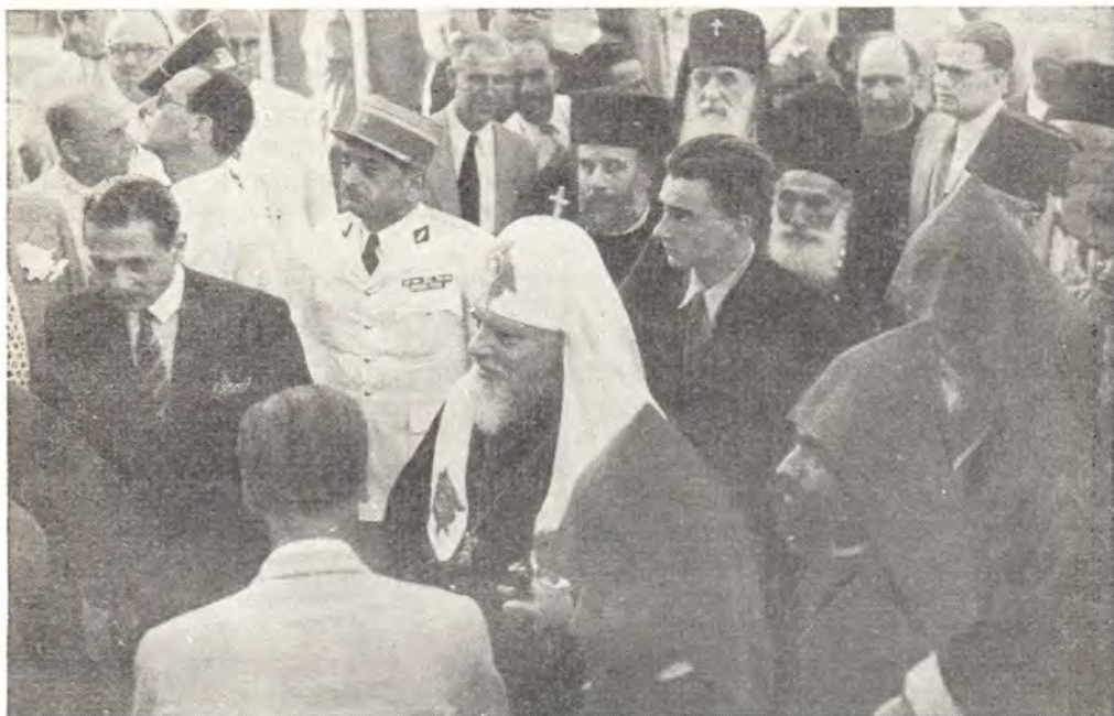
СВЯТЕЙШИЙ ПАТРИАРХ АЛЕКСИЙ В БЕЙРУТЕ ВО ВРЕМЯ ПУТЕШЕСТВИЯ НА ВОСТОК 28/V—26/VI 1945 г.

протяжении 22 лет. Новгородская духовная семинария, которую он должен был с этого дня возглавлять, являлась учебным заведением с крепкими вековыми традициями. Великий угодник Божий, Святитель Тихон Задонский был воспитанником новгородской бурсы. «Словом мира и любви о Христе приветствую вас, возлюбленные братья», — так начал свою первую речь в Новгородской семинарии новый ректор. Затем, обращаясь к учителям, архимандрит говорит им: «...Возгревайте в сердцах ваших питомцев любовь и преданность святому Православию, любовь к пастырскому и учительному деланию, научайте их примером собственной жизни упорству в труде, любви к истинной науке» 19 .