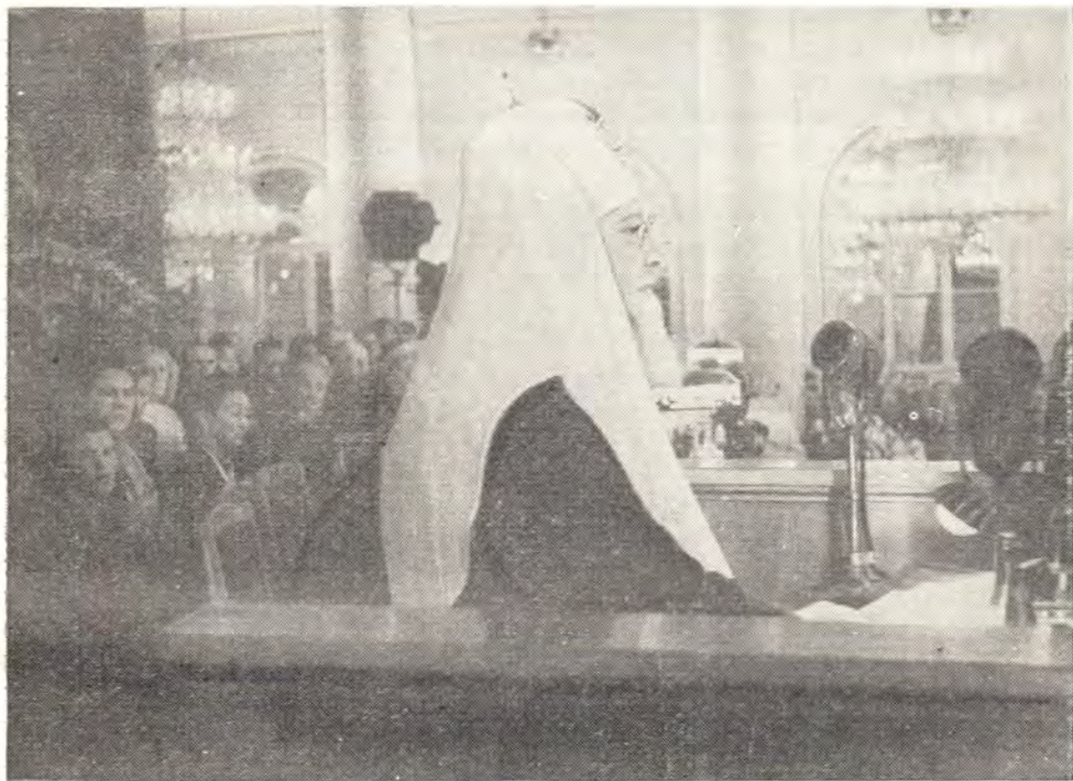
ВЫСТУПЛЕНИЕ ПАТРИАРХА АЛЕКСИЯ НА ТРЕТЬЕЙ ВСЕСОЮЗНОЙ КОНФЕРЕНЦИИ СТОРОННИКОВ МИРА 19 НОЯБРЯ 1951 г.

Ульяновск стал в это время центром управления Русской Православной Церковью. Здесь, на Шатальной улице, в небольшом деревянном доме, расположилась Московская Патриархия. Между тем по всей необъятной территории Советского Союза разворачивалось мощное церковно-патриотическое движение. В эти героические времена, когда советский народ боролся, напрягая все свои силы, с жестоким, смертельным врагом,