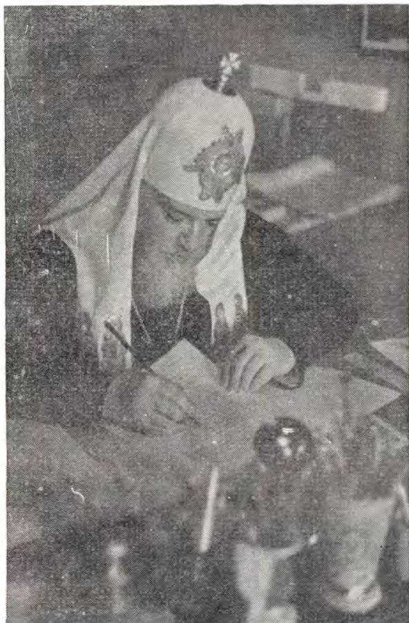
СВЯТЕЙШИЙ ПАТРИАРХ АЛЕКСИЙ ЗА РАБОТОЙ

щаяся жизнь птенца в яйце, которому, когда вскроется скорлупа, открывается более совершенный и обширный круг жизни, о котором в яйце не может даже предполагать птенец. Теперь, когда Христос воскрес, нет более решительной грани между небом и землею, ибо и на земле пребыло Божество во образе человеческом, и на небе возжено человечество, обо-жественное в лице благоволившего именовать Себя Сыном Человече-ским» 17 .