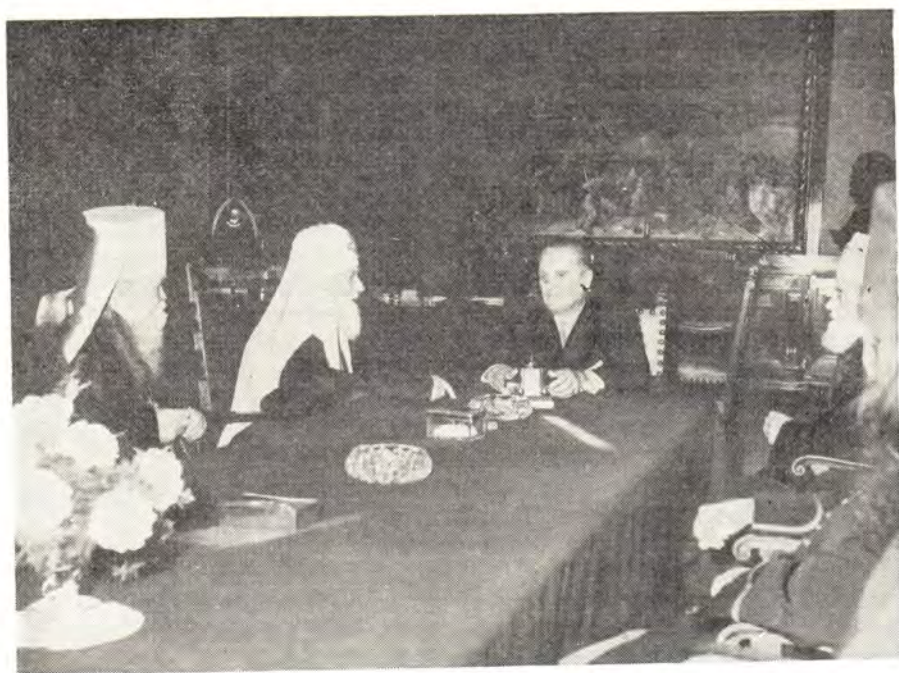
СВЯТЕЙШИЙ ПАТРИАРХ АЛЕКСИЙ И ЧЛЕНЫ ДЕЛЕГАЦИИ РУССКОЙ ПРАВОСЛАВНОЙ ЦЕРКВИ В СОПРОВОЖДЕНИИ ПАТРИАРХА СЕРБСКОГО ВИКЕНТИЯ НА ПРИЕМЕ У ПРЕЗИДЕНТА ФНРЮ ИОСИПА БРОЗ-ТИТО

все русские люди, оторванные от Родины и находящиеся в рассеянии по всему лицу земли, объединялись, оставив всякое греховное разделение, около своей Матери-Церкви! Какая бы это была для них крепкая опора в их трудной страннической жизни, вдали от родной земли! Вам, русским людям, хранящим в сердцах своих неугасимую любовь к родной Церкви и Отечеству, я передаю благословение Божие и в знамение этого благословения вручаю вам св. икону Спасителя нашего, Господа Иисуса Христа, Который да хранит вас в мире, под божественным кровом Своей благодати и милости».