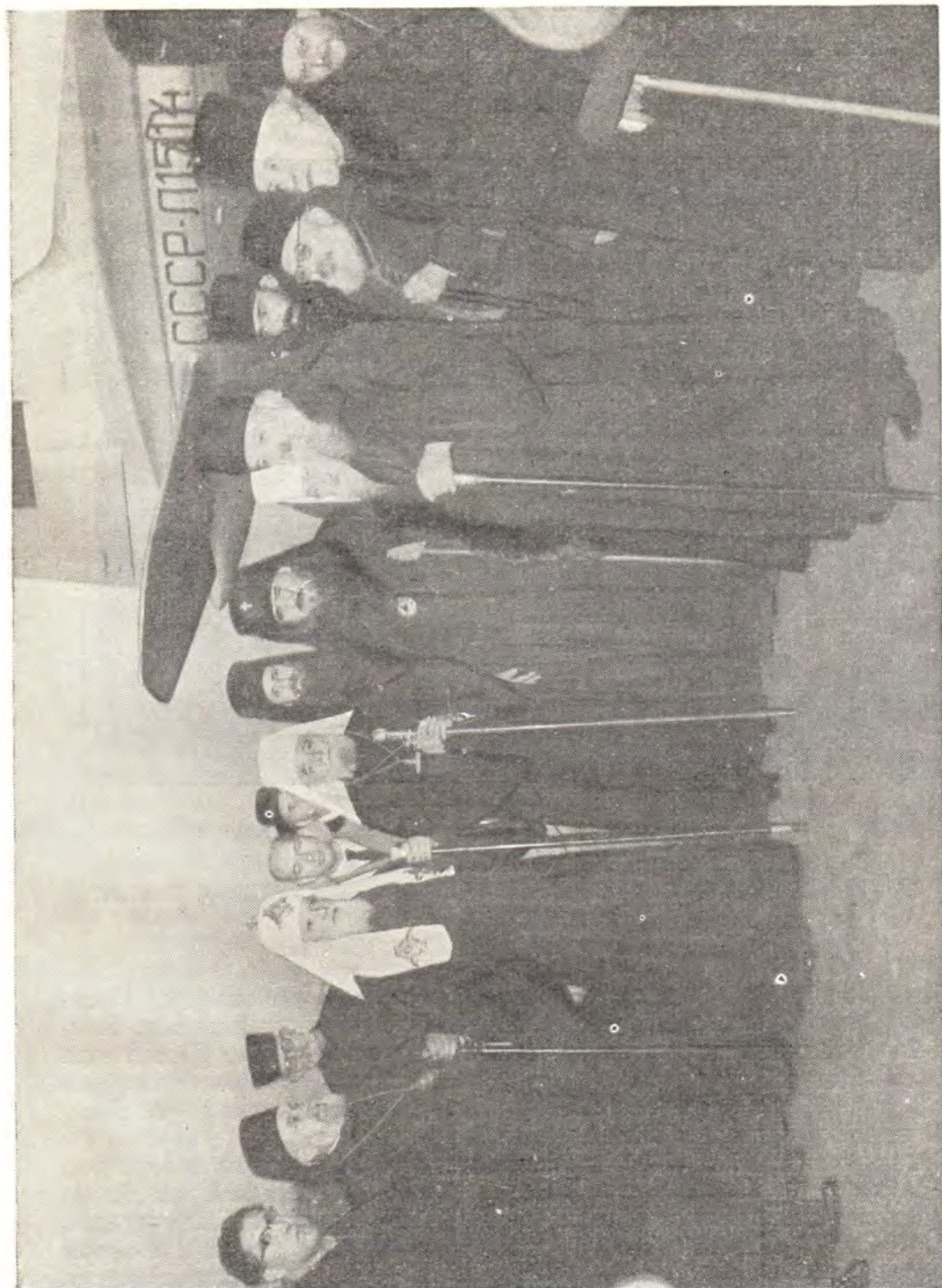
ПРИБЫТИЕ ДЕЛЕГАЦИИ РУССКОЙ ПРАВОСЛАВНОЙ ЦЕРКВИ ВО ГЛАВЕ С ПАТРИАРХОМ АЛЕКСИЕМ НА ЗИМУНСКИЙ АЭРОДРОМ В БЕЛГРАДЕ. На снимке ПАТРИАРХ АЛЕКСИЙ, СЕРЕБСКИЙ ПАТРИАРХ ВИКЕНТИЙ, РУССКОЕ И СЕРЕБСКОЕ ДУХОВЕНСТВО