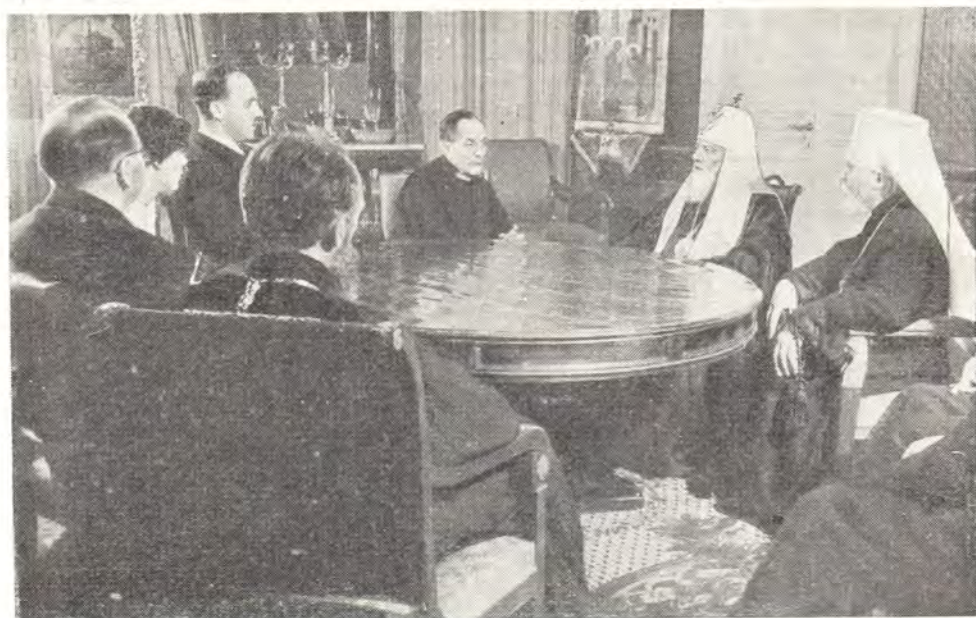
ПАСТОР МАРТИН НИМЕЛЛЕР НА ПРИЕМЕ У СВЯТЕЙШЕГО ПАТРИАРХА АЛЕКСИЯ. 1952 г.