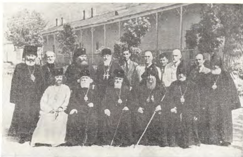
ВСТРЕЧА ПАТРИАРХА АЛЕКСИЯ, ПАТРИАРХА-КАТОЛИКОСА КАЛЛИСТРАТА И ПАТРИАРХА-КАТОЛИКОСА ГЕОРГА VI В ЭЧМИАДЗИНЕ В 1950 г.