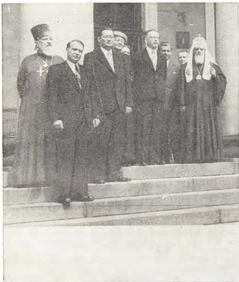
ДЕЛЕГАЦИЯ ЕВАНГЕЛИЧЕСКО-ЛЮТЕРАНСКОЙ ЦЕРКВИ ГЕРМАНИИ ВО ВРЕМЯ ПОСЕЩЕНИЯ МОСКОВСКОЙ ПАТРИАРХИИ В 1954 г.