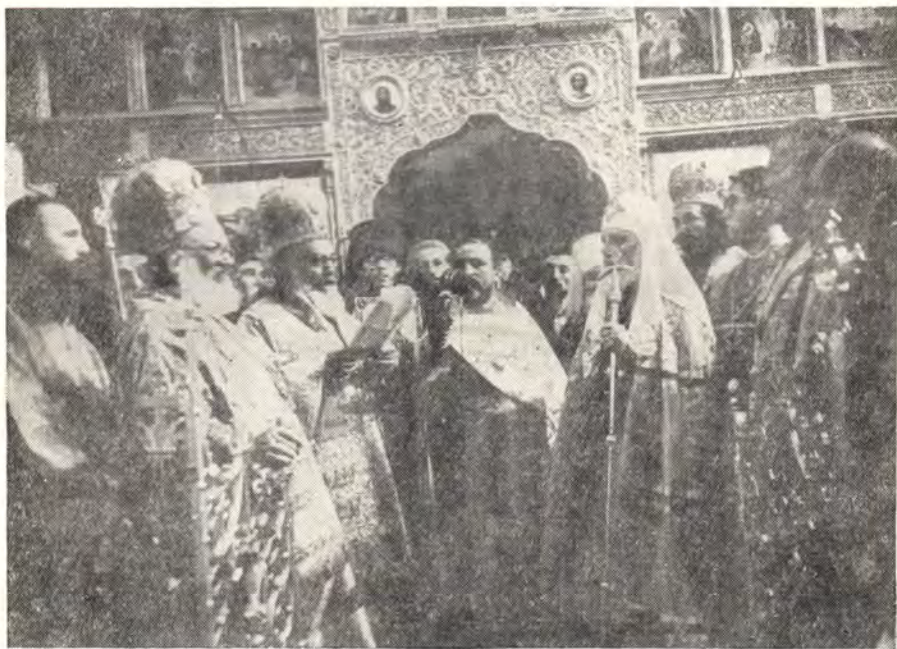
ПАТРИАРХ БОЛГАРСКИЙ КИРИЛЛ ПРИВЕТСТВУЕТ ПАТРИАРХА АЛЕКСИЯ

16 сентября гости группами посещали Княжевскую женскую обитель в честь Покрова Пресвятой Богородицы и осматривали достопримечательности болгарской столицы. Вечером Синод Болгарской Церкви дал официальный ужин в гостинице «Балкан» в честь Патриарха Алексия и церковной делегации, на котором присутствовали Председатель Комитета по вопросам Болгарской Православной Церкви М. Кючуков, Первый Секретарь Советского посольства в Болгарии В. А. Гусев и представители болгарской общественности.