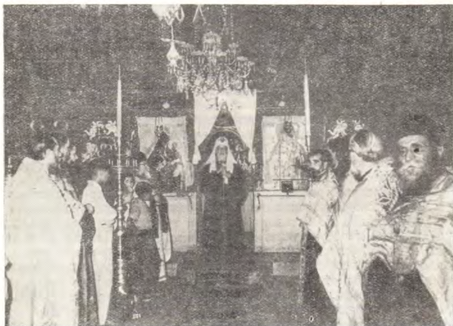
МОЛЕБЕН В СОБОРНОМ ХРАМЕ МОНАСТЫРЯ ПРЕСВЯТОЙ БОГОРОДИЦЫ. ПАТРИАРХ АЛЕКСИЙ ПРОИЗНОСИТ СЛОВО

ственный ужин, на котором присутствовали Святейшие Патриархи, все архиереи Болгарской Церкви, члены делегации Русской Православной Церкви, прикомандированные к ним лица, Заместитель Министра иностранных дел Живко Живков и другие представители Болгарского правительства, болгарских общественных организаций, а также Первый Секретарь Советского посольства в Болгарии В. А. Гусев. Патриарха Алексия приветствовали речами Председатель Комитета по вопросам Болгарской Православной Церкви Михаил Кючуков, Председатель Славянского Комитета Болгарии Найден Николов, и Председатель Общества Болгаро-Советской дружбы Цола Драгойчева.