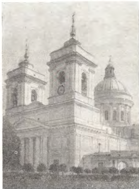
СВЯТО-ТРОИЦКИЙ СОБОР АЛЕКСАНДРО-НЕВСКОЙ ЛАВРЫ В ЛЕНИНГРАДЕ

Свято-Троицкий собор Александро-Невской Лавры — одно из самых прекрасных храмовых сооружений классического Петербурга конца XVIII века. По своим величественным размерам и великолепному внутреннему убранству этот собор, вместе со всем ансамблем Лавры, всегда был украшением Петербурга. Вместе с тем он послужил архитектурным образцом для многих храмовых построек в России конца XVIII века.