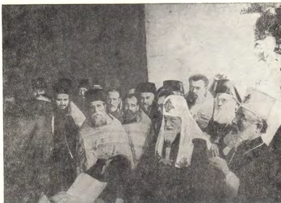
ЕПИСКОП ИОНА ПРИВЕТСТВУЕТ СВЯТЕЙШЕГО ПАТРИАРХА АЛЕКСИЯ В БАЧКОВСКОМ МОНАСТЫРЕ

14 сентября Святейший Патриарх Алексей и члены делегации посетили старинный Бачковский монастырь. И на этот раз стоявшие по пути следования толпы народа во главе с духовенством радостно приветствовали гостей. Святейший Патриарх Алексей благословлял благоче-