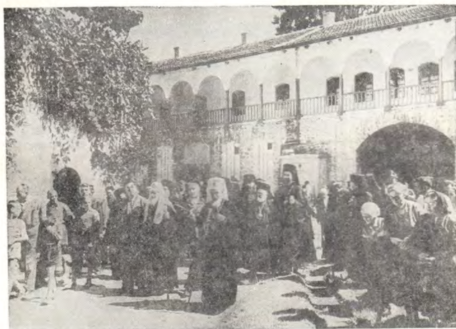
ПАТРИАРХ АЛЕКСИЙ, ПАТРИАРХ КИРИЛЛ И СОПРОВОЖДАЮЩИЕ ИХ ЛИЦА НА ТЕРРИТОРИИ БАЧКОВСКОГО МОНАСТЫРЯ