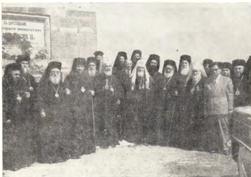
ПАТРИАРХ АЛЕКСИЙ И ПАТРИАРХ КИРИЛЛ С СОПРОВОЖДАЮЩИМИ ИХ ЛИЦАМИ ПОСЛЕ ВОЗЛОЖЕНИЯ ВЕНКА К ПАМЯТНИКУ РУССКИХ ВОИНОВ — ГЕРОЕВ ШИПКИ

Вечная слава чудо-богатырям, положившим жизнь свою за нашу свободу! Вечная признательность их великой Родине! Да пребудет в славе и величии благородный русский народ!»