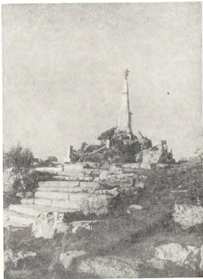
ПАМЯТНИК ОТВАГЕ И СВЯЩЕННОМУ САМОПОЖЕРТВО- ВАНИЮ РУССКИХ ВОИНОВ, ПАВШИХ В ВОЙНЕ ЗА ОСВОБОЖДЕНИЕ БОЛГАРИИ, НА ШИПКИНСКОМ ПЕРЕВАЛЕ

Мы счастливы, что вступаем на землю братского болгарского народа в дни, когда празднуется так торжественно 80-летие освобождения Болгарии от векового чужеземного ига.