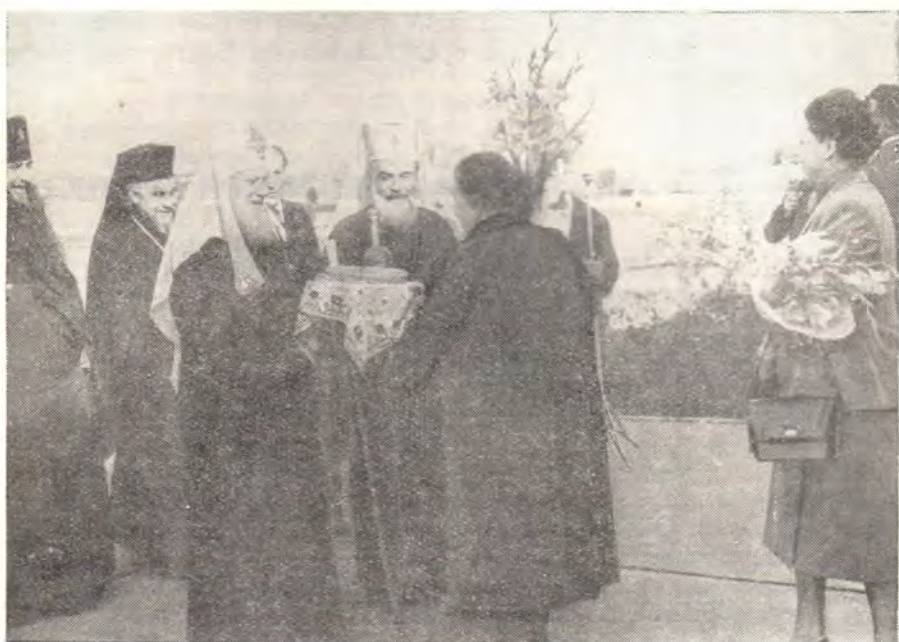
ВСТРЕЧА ПАТРИАРХА АЛЕКСИЯ С ХЛЕБОМ-СОЛЬЮ ПО СТАРИННОМУ НАРОДНОМУ ОБЫЧАЮ