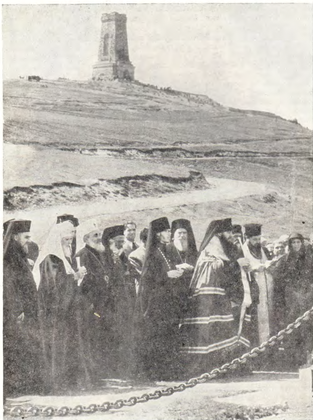
ЛИТИЯ НА БРАТСКОЙ МОГИЛЕ РУССКИХ ВОИНОВ НА ШИПКЕ