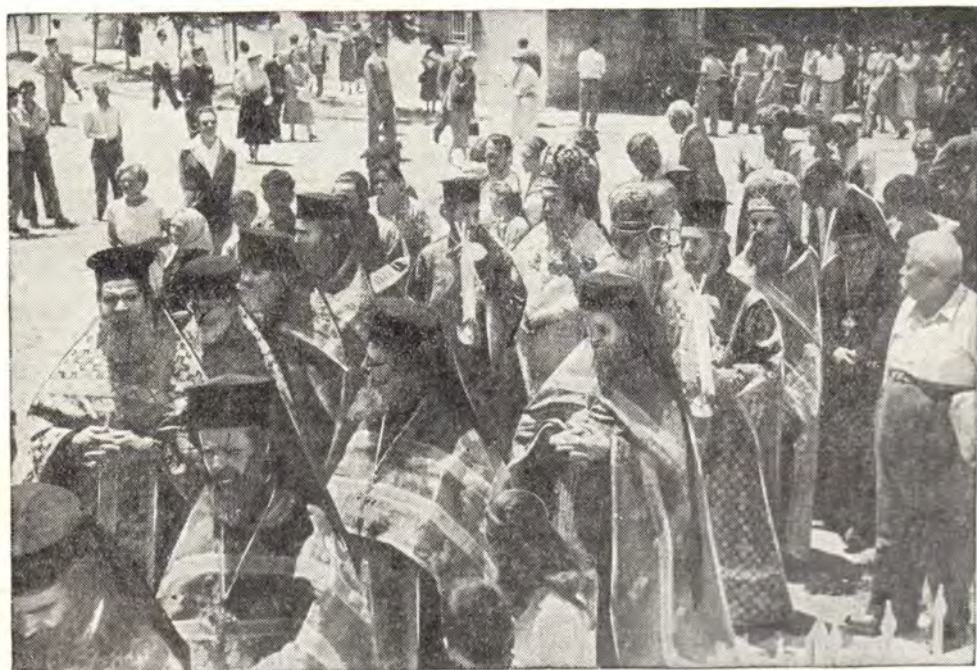
АРХИЕПИСКОП СЕБАСТИЙСКИЙ АФИНАГОР, МИТРОПОЛИТ НАЗАРЕТСКИЙ ИСИДОР И АРХИМАНДРИТ ПИМЕН С СОНМОМ ДУХОВЕНСТВА ВО ВРЕМЯ КРЕСТНОГО ХОДА ВОКРУГ СОБОРА СЯТОЙ ТРОИЦЫ