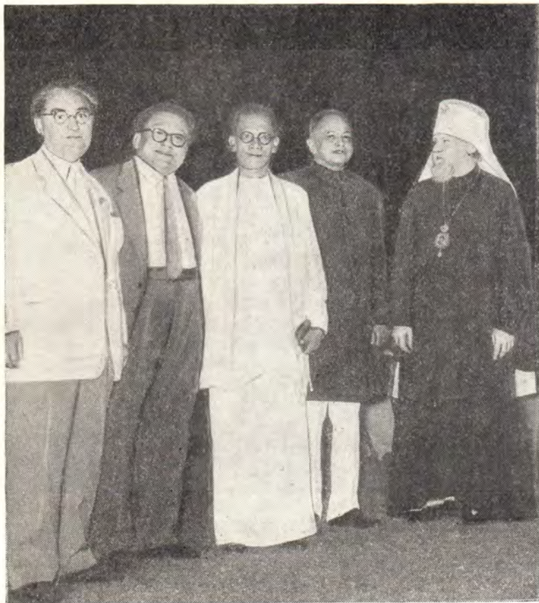
МИТРОПОЛИТ НИКОЛАЙ НА ПРИЕМЕ У ПРЕМЬЕР-МИНИСТРА ЦЕЙЛОНА г. С. БАНДАРANAИКЕ

Запрещение ядерного оружия, прекращение его испытаний — вот главный вопрос, который со всей остротой и неотложностью стоит в наши дни перед человечеством. Выражая волю всех сил мира, всех народов, именно это требование Всемирный Совет Мира поставил на этой своей сессии в центр внимания мировой общественности.