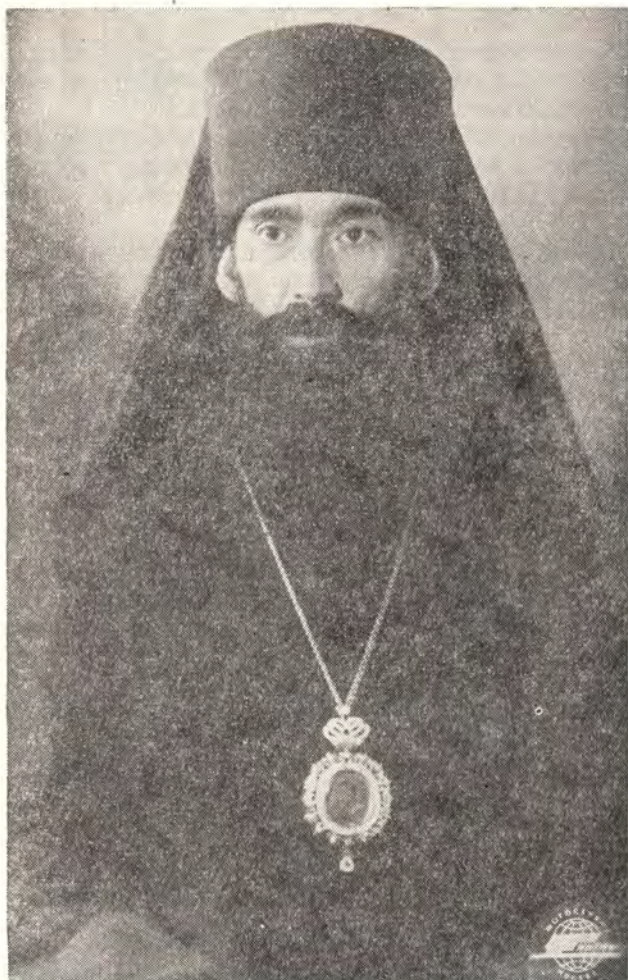
ПАВЕЛ, ЕПИСКОП МОЛотовский и соликамский

С детства заброшенный волею судеб в чужие края, далеко от любимой Родины, я, благодаря Господа, все же был воспитан в духе православной веры и горячей любви к моему великому народу.