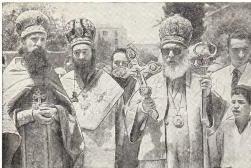
АРХИЕПИСКОП СЕБАСТИЙСКИЙ АФИНАГОР, МИТРОПОЛИТ НАЗАРЕТСКИЙ ИСИДОР И НАЧАЛЬНИК РУССКОЙ ПРАВОСЛАВНОЙ МИССИИ В ИЕРУСАЛИМЕ АРХИМАНДРИТ ПИМЕН СОВЕРШАЮТ МОЛЕБЕН В ДЕНЬ СЯТОЙ ТРОИЦЫ У СОБОРА