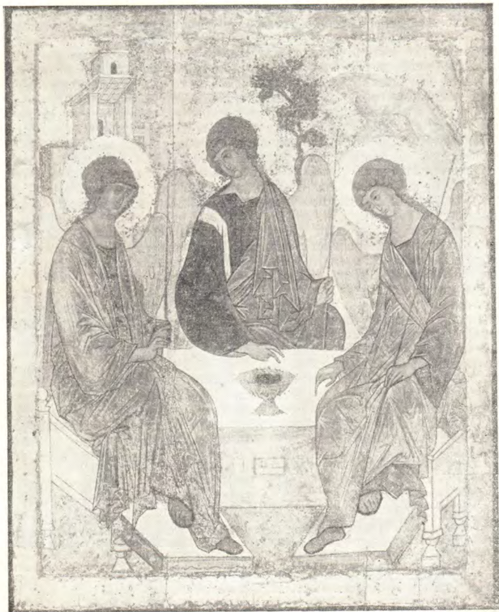
СВЯТАЯ ТРОИЦА (ИКОНА А. РУБЛЕВА XV ВЕКА)