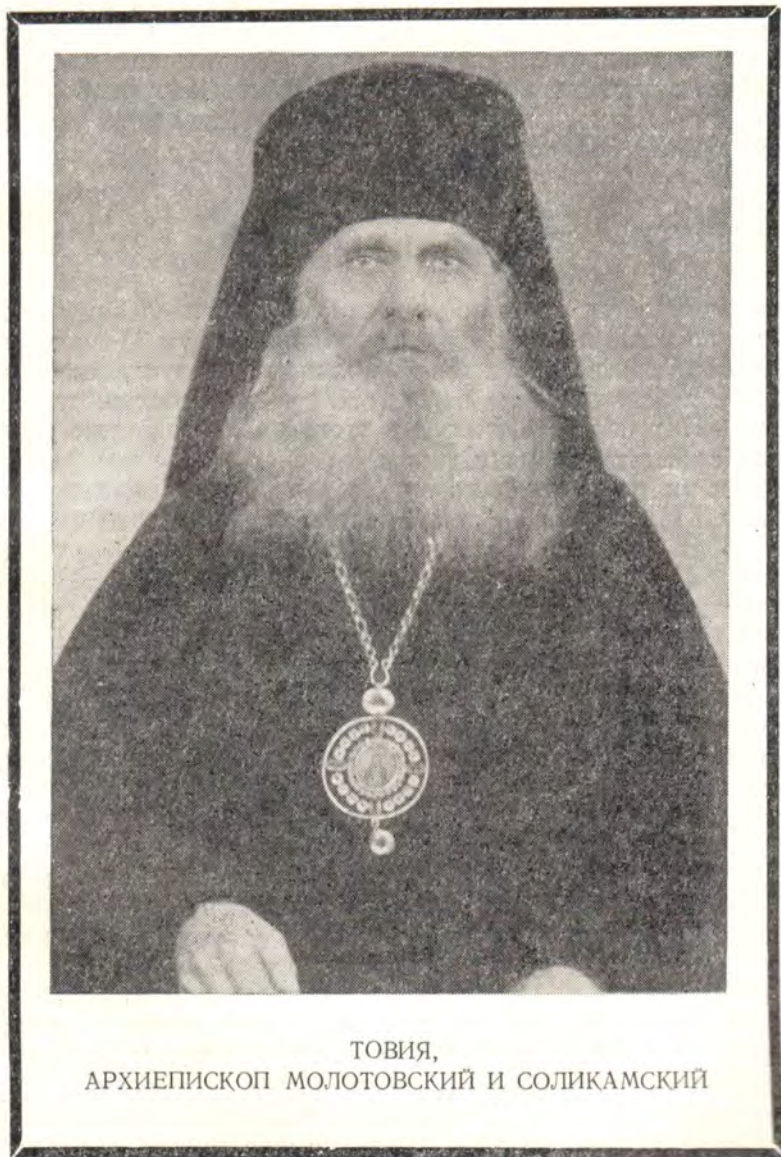
ТОВИЯ, АРХИЕПИСКОП МОЛОТОВСКИЙ И СОЛИКАМСКИЙ

Архиепископ Товия, в мире Александр Ильич Остроумов, родился 25 марта 1884 года в семье священника. В 1905 году он окончил Московскую духовную семинарию, а в 1912 году — Археологический институт в Москве. В том же году он принял священнический сан и пастыр-