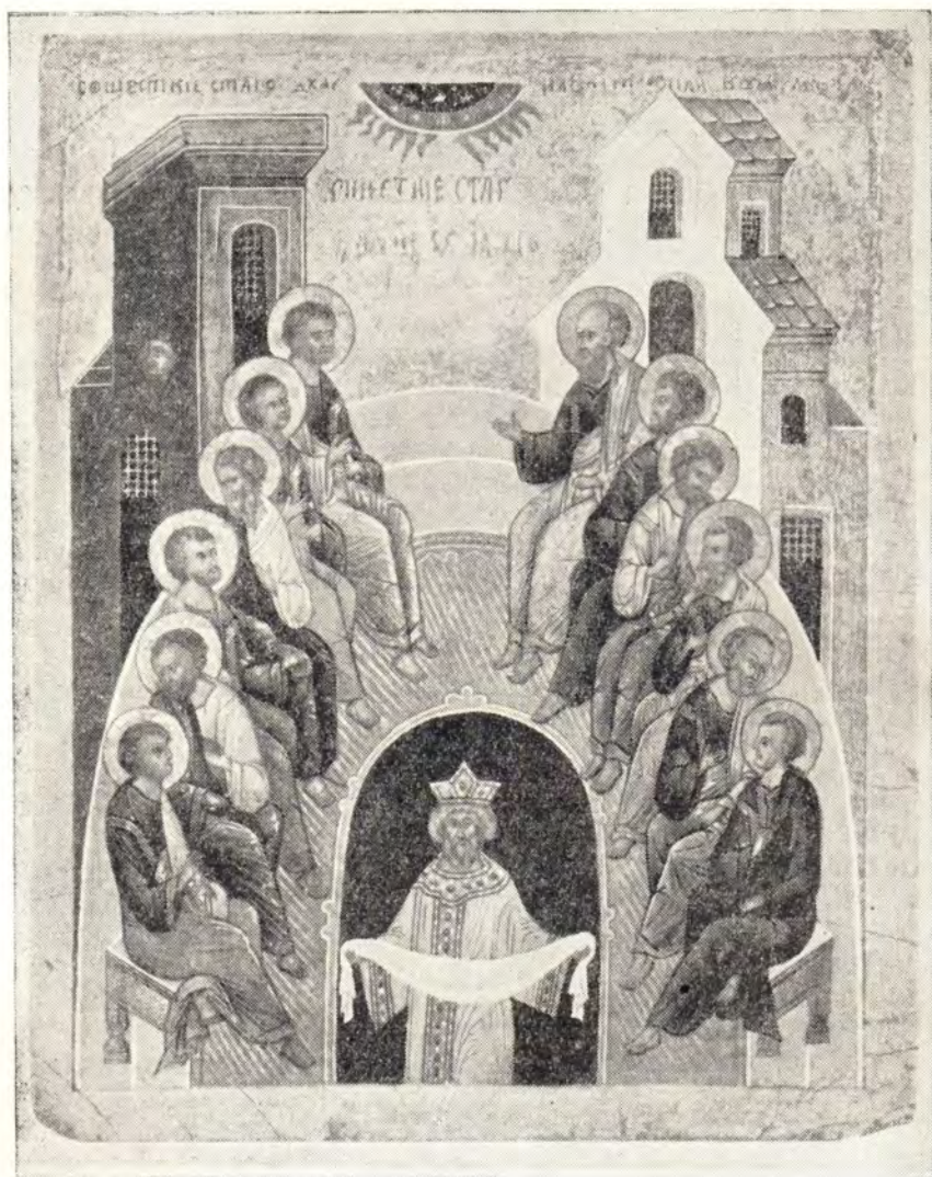
СОШЕСТВИЕ СВАГО ДУХА (ИКОНА НОВГОРОДСКОЙ ШКОЛЫ КОНЦА XV ВЕКА)