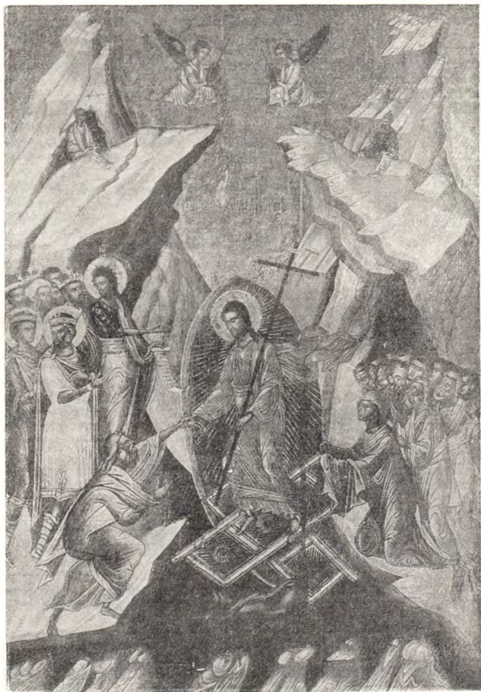
СОШЕСТВИЕ ВО АД