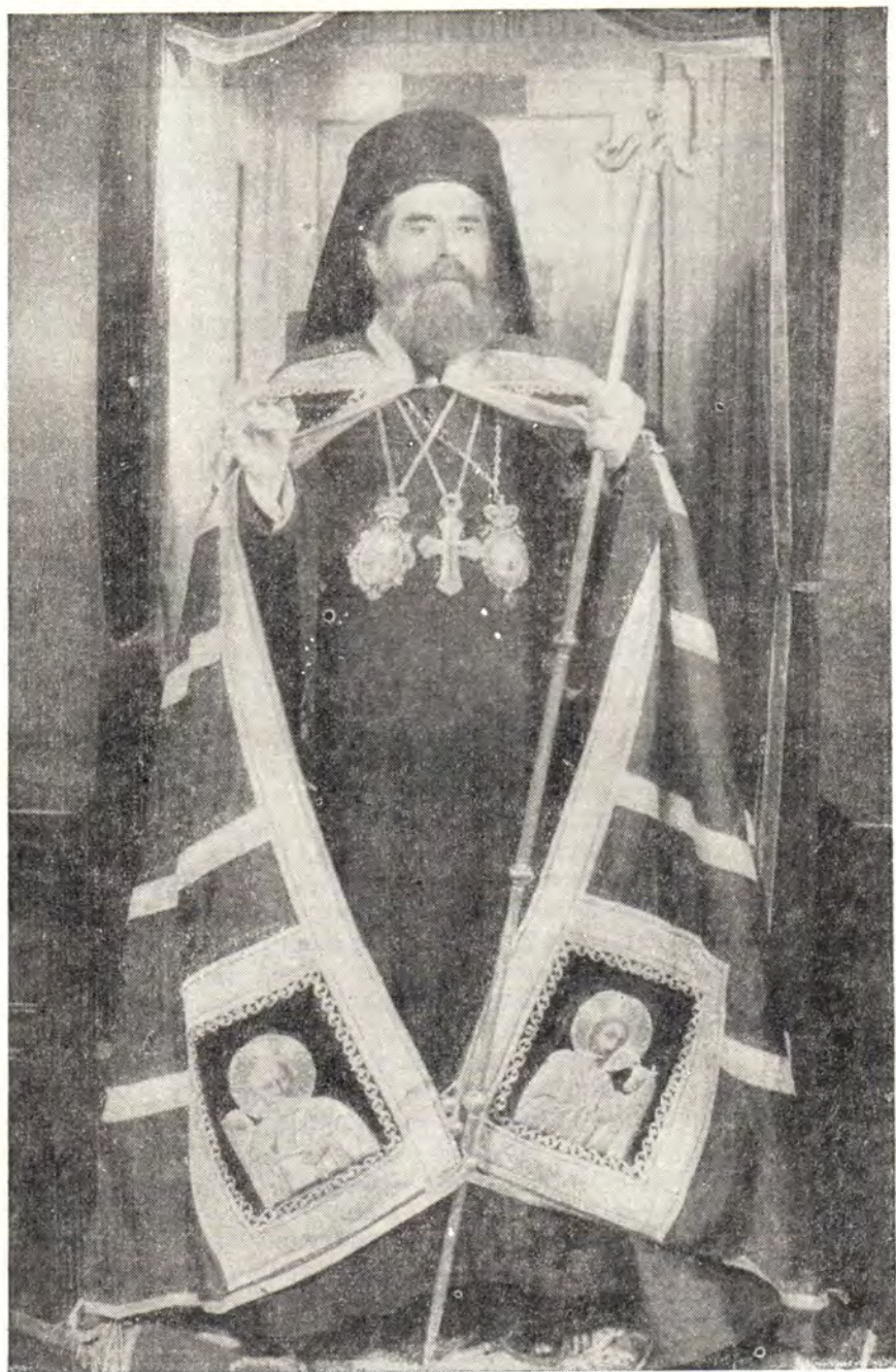
НОВЫЙ ПРЕДСТОЯТЕЛЬ ИЕРУСАЛИМСКОЙ ЦЕРКВИ БЛАЖЕННЕЙШИЙ ПАТРИАРХ ВЕНЕДИКТ I